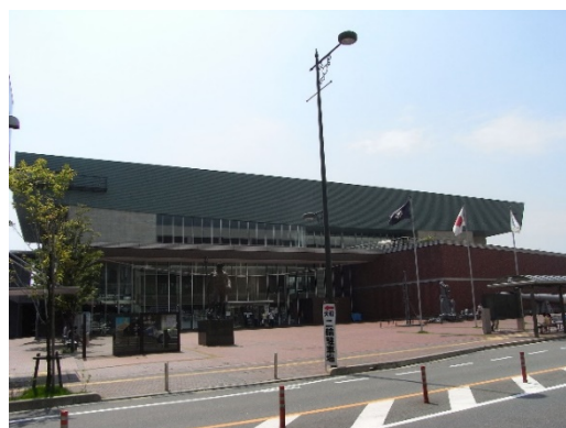
大和ミュージアム