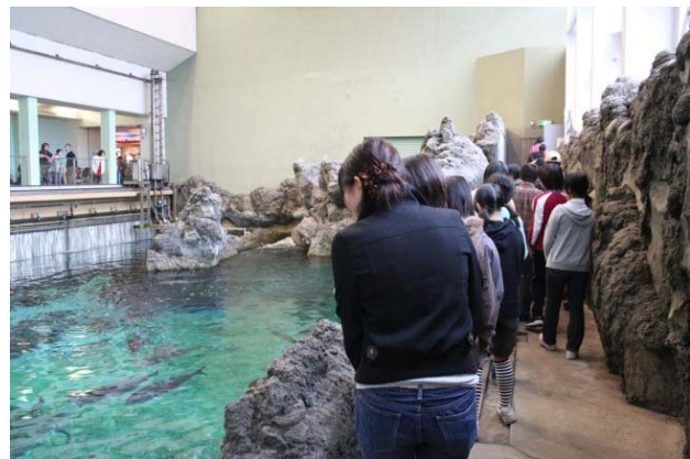
須磨海浜水族園バックヤードツアー