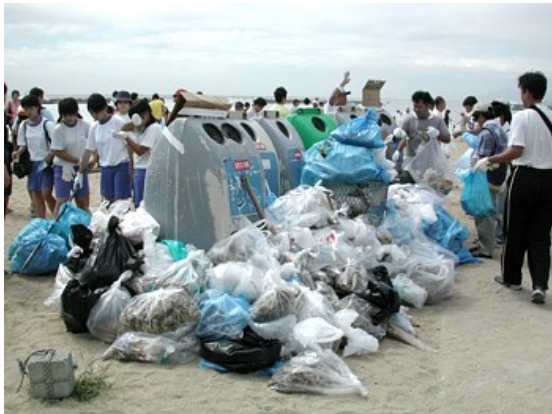
須磨海岸ビーチクリーンアップ

今年は海岸清掃の活動に加え、生きものや自然・環境問題などを学ぶために、昼食後に須磨海浜水族園のバックヤードツアーを行います。（バックヤードツアーのみの参加は受け付けません。）どなたでも気軽に参加していただけますので、皆様ふるってのご参加をお待ちしております！