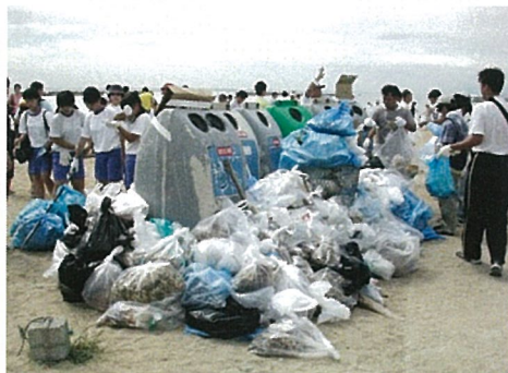
ビーチクリーンアップ in SUMA

今年は海岸清掃後に当学会主催で、須磨水族園のスタッフにいたるかを自然海域で遊泳させるドルフィンプロジェクトについて説明して頂きます。いらか遊泳の問題の一つに漂着ゴミがあり、海岸清掃の意義が学べる大変良い機会になると思います。どなたでも気軽に参加して頂けますので、皆様ふるってのご参加をお待ちしております！