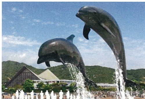
須磨海浜水族園スタッフによる講演会